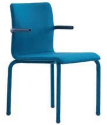
SKINNY - ARCO

zijn voor het onzichtbare, voor de binnenkant. Meubels die interessant zijn door een vernieuwend productieproces. Ik zou zelf graag onzichtbare meubels maken. De Slim Table van op metaal gelijmd hout is wel een goed voorbeeld. Je loopt er snel aan voorbij en pas op het tweede gezicht ontdek je dat juist die tafel misschien wel het best voldoet aan wat je wilt. De Revolving Chandelier is een ander voorbeeld. Het is een lamp zonder duidelijk silhouet, een verwarrend ding waar je oog moeilijk grip op krijgt.”