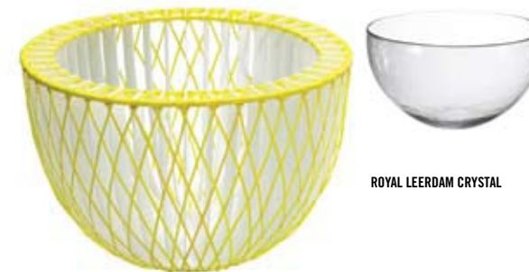
ROYAL LEERDAM CRYSTAL