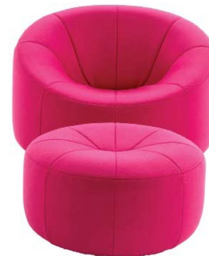
PUMPKIN - LIGNE ROSET

Het is opvallend dat van de Nederlandse ontwerpers van nu nagenoeg niemand hem als een inspiratiebron noemt. Toch is hij heel belangrijk geweest, alleen al omdat hij door zijn revolutionaire ontwerpen voor Artifort internationale aandacht op de Nederlandse meubelindustrie vestigde. Dat was al in de jaren 50 en 60 van de vorige eeuw.