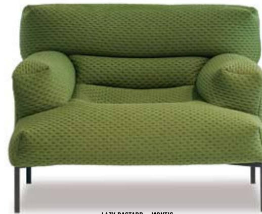
LAZY BASTARD - MONTIS

“De Lazy Bastard gaat over heel veel dingen: over een student van nu die geen zitzak meer wil, maar wel een stoel met het comfort van een zitzak. Over een meubel dat er na één keer gebruiken uitziet alsof het je het al jaren hebt, zonder dat de stof oud of versleten oogt. Over een ding dat meteen al zo comfortabel zit als je favoriete spijkerbroek. Over de ultieme plofbank.”