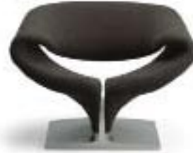
RIBBON - ARTIFORT

suggereren, zijn ze veelal organisch van vorm. De constructie was ondergeschikt aan die vloeiende vorm. Maar Paulins motto was: 'een fauteuil moet de zitter beschermen'. Dat betekende dat zijn meubels behalve mooi van vorm ook comfortabel en behaaglijk moesten zijn. Ze waren bedoeld als 'mooie dingen voor gewone mensen', maar sloegen ook aan bij het avant-gardepubliek. Soms werden de meubels aan de man gebracht met spectaculaire advertenties. Heel bekend is bijvoorbeeld de foto van een Ribbon Chair op een startbaan met een opstijgende jumbo jet die erboven zweeft.