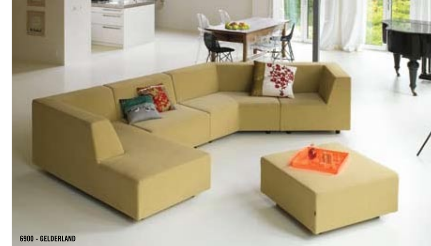
6900 - GELDERLAND