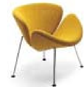
ORANGE SLICE - ARTIFORT