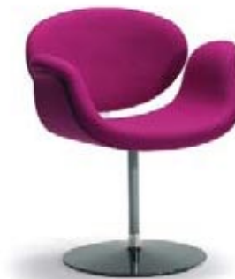
LITTLE TULIP - ARTIFORT