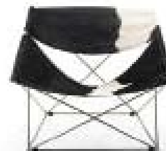
BUTTERFLY - ARTIFORT