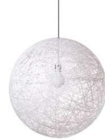
RANDOM LIGHT - MOOOI

“Op zich wel. Ik vind alleen dat ze soms te vaak worden ingeschakeld om aandachttrekkers te ontwerpen, dingen die visueel spectaculair zijn. Terwijl er meer respect zou kunnen