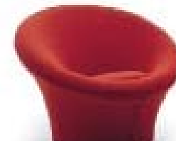
MUSHROOM - ARTIFORT