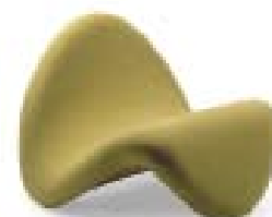
TONGUE - ARTIFORT

Oyster, Orange Slice, Tongue, Mushroom, Butterfly, Little Tulip: zoals de flora- en fauna-namen van de meubels al