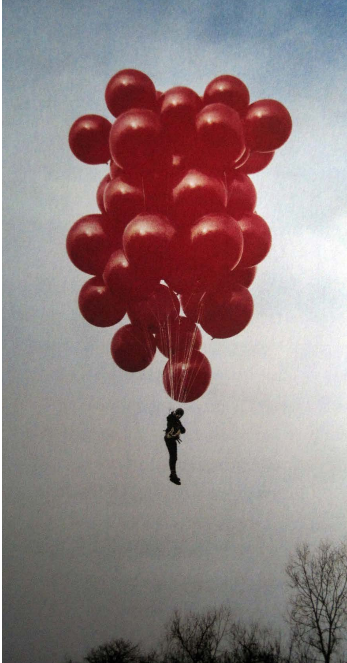
Fiona Tan 1966 Lift , 2000 Zeefdruk, 85 x 40 cm Haarlem, Frans Hals Museum | De Hallen Haarlem