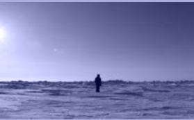
Guido van der Werve Nummer negen, The day I didn't turn with the world, 2007 HD video op minipac, 9 minuten Frans Hals Museum | De Hallen Haarlem

‘Dat klopt wel. Misschien juist ook bij wolken die niet realistisch geschilderd zijn, maar bijvoorbeeld impressionistisch. Dat kan nieuwsgierig maken of jij diezelfde intense beleving kunt hebben bij de wolken als de kunstenaar blijkbaar had. Kunst nodigt je absoluut uit om anders naar dingen kijken, zeker ook naar de lucht.’