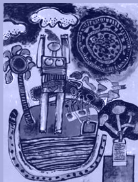
Corneille 1922-2010 Tropique , 1968 Lithografie, 76 x 56,6 cm Haarlem, Frans Hals Museum | De Hallen Haarlem