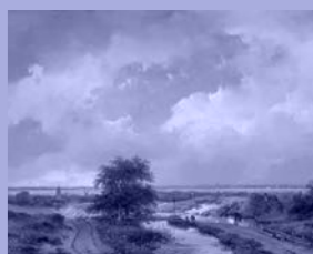
Andreas Schelfhout Duinlandschap met zicht op Haarlem , 1847 Olieverf op paneel Collectie Simonis & Buunk, Ede