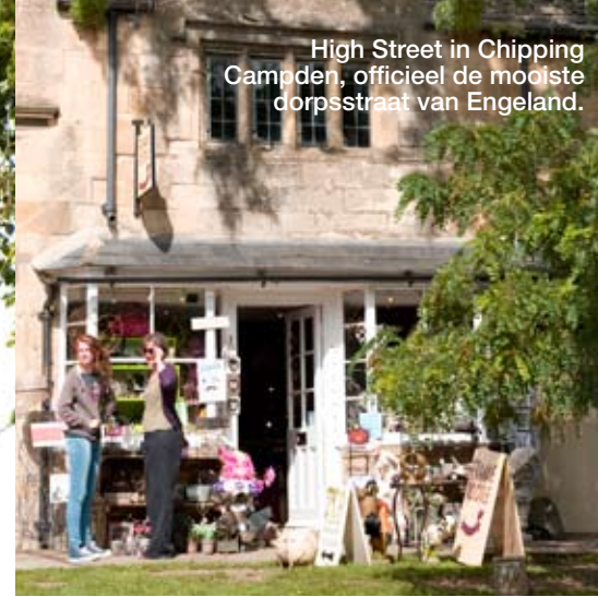
High Street in Chipping Campden, officieel de mooiste dorpsstraat van Engeland.