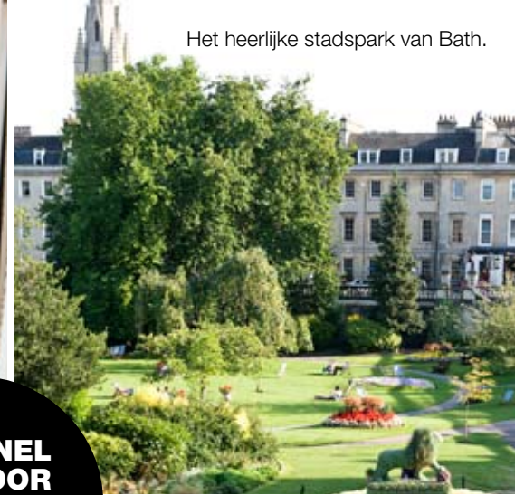
Het heerlijke stadspark van Bath.