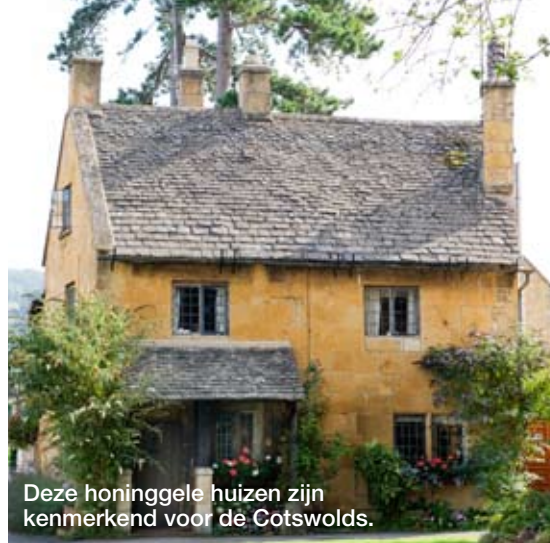
Deze honinggele huizen zijn kenmerkend voor de Cotswolds.