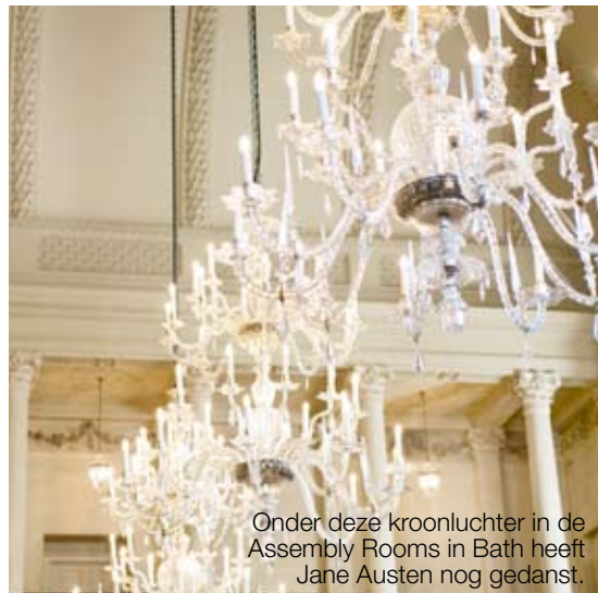
Onder deze kroonluchter in de Assembly Rooms in Bath heeft Jane Austen nog gedanst.