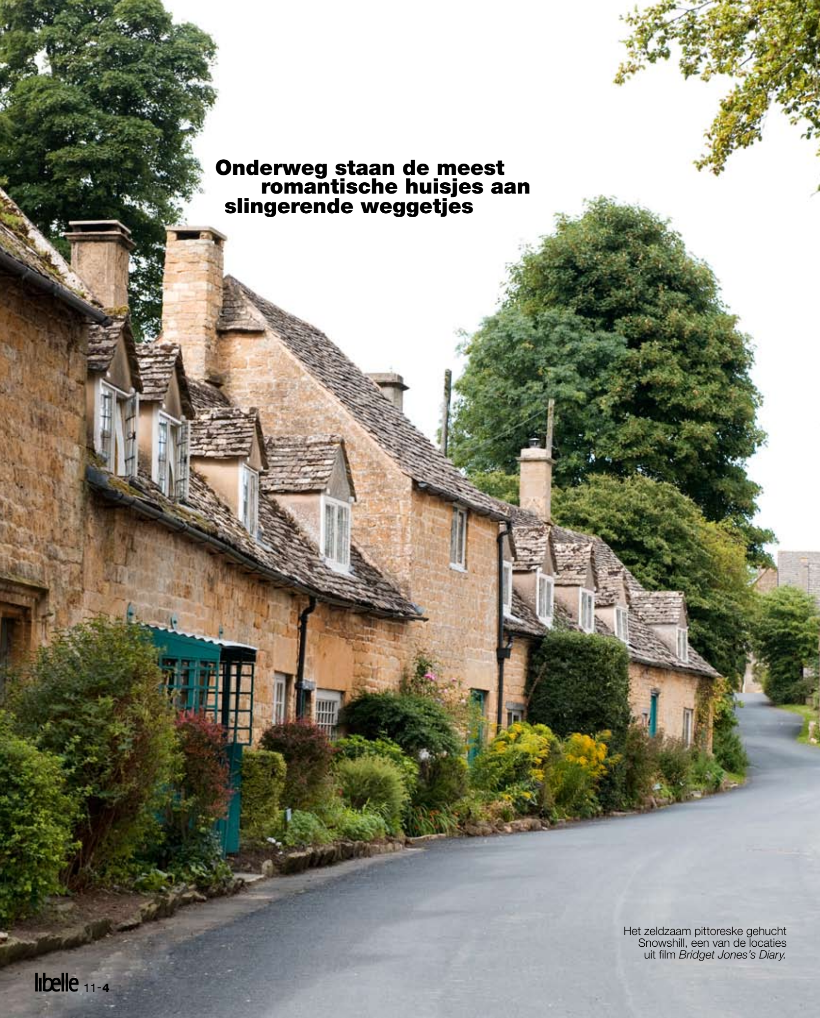
Het zeldzaam pittoreske gehucht Snowhill, een van de locaties uit film Bridget Jones's Diary .

Onderweg staan de meest romantische huisjes aan slingerende weggetjes