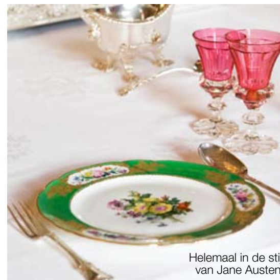
Helemaal in de stijl van Jane Austen.